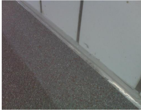
Garganta hueca terminada con perfil